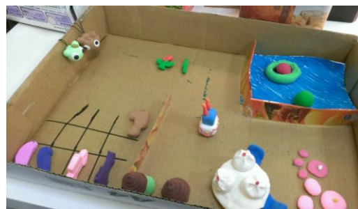
▲和小朋友們一起捏黏土，右圖是大家發揮創意捏出來的成品。