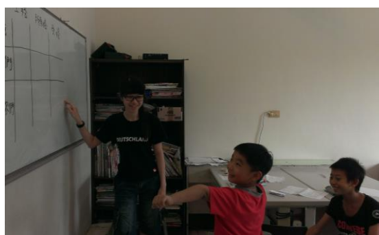
▲ 讓小朋友用黏黏球玩英文遊戲，效果不錯。