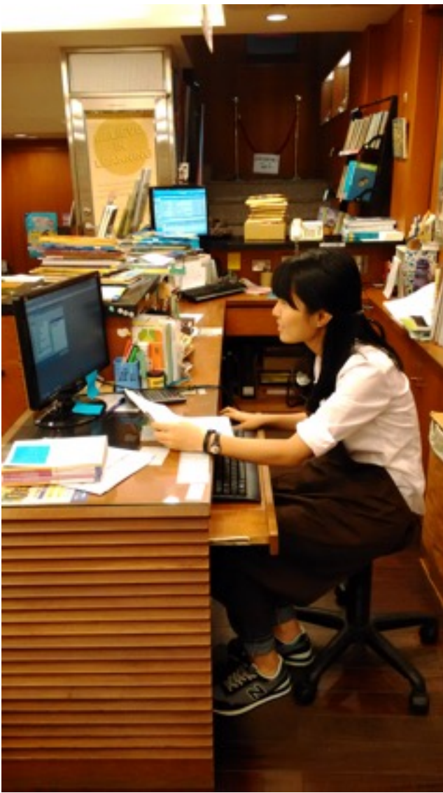
✿操作電腦軟體：收料