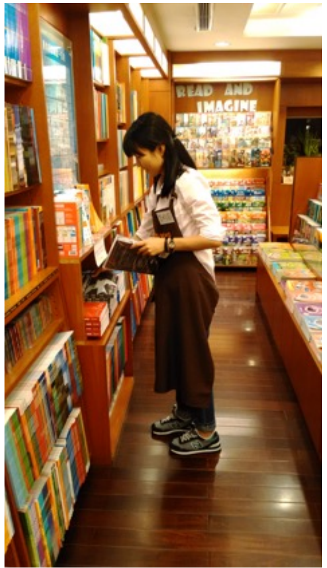
✿整理書櫃，將書上架